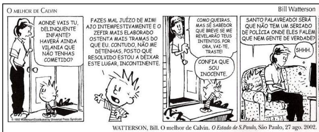
WATTERSON, Bill. O melhor de Calvin. O Estado de S.Paulo, São Paulo, 27 ago. 2002.

O preconceito linguístico – o mais sutil de todos eles – atinge um dos mais nobres legados do homem, que é o domínio de uma língua. Exercer isso é retirar o direito de fala de milhares de pessoas que se exprimem em formas sem prestígio social. Não quero dizer com isso que não temos o direito de gostar mais, ou menos, do falar de uma região ou de outra, do falar de um grupo social ou de outro. O que afirmo e até enfatizo é que ninguém tem o direito de humilhar o outro pela forma de falar. Ninguém tem o direito de exercer assédio linguístico. Ninguém tem o direito de causar constrangimento ao seu semelhante pela forma de falar.